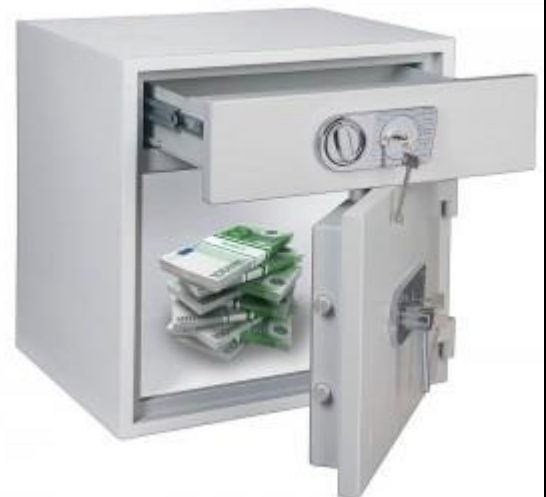
Schublidentresor D1-70 DB/DB