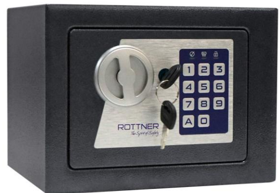
Jupiter 1 EL