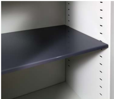
Durchgehende Stelleisen für Fachböden

Möbeleinsatz-Tresore der Baureihe EM/ZM werden nach den Vorgaben der EN 1143-1, Widerstandsgrad I, produziert. Optimale Testergebnisse dokumentieren die hohen Sicherheitswerte für diese Serie. Die versicherungstechnische Einstufung von 65.000 Euro (privat) kennzeichnet die technisch aufwendige Bauweise. Die integrierte Feuerschutzisolierung (nach DIN 4102) bietet darüber hinaus Schutz bei Bränden. Die Baureihe EM/ZM erfüllt ein hohes Anforderungsprofil. Die Sicherheit Ihrer Dokumente, Akten und Werte ist in dieser anspruchsvollen Baureihe realisiert und gesichert.