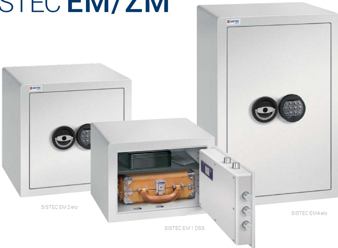
SISTEC EM 2 elo